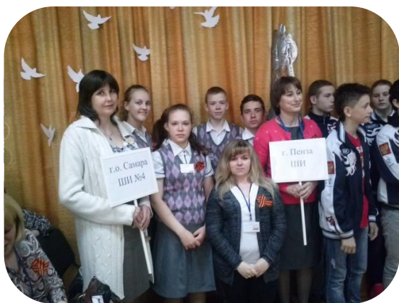
наша команда на открытие Марафона

С 6 по 8 мая в городе Энгельсе проходил Марафон знаний посвященный «Актуальным вопросам духовно-нравственного и патриотического воспитания детей с нарушением слуха к 70-летию Победы в Великой Отечественной войне». Нашу школу представляли учащиеся 7 «а» и 9 «а» классов. Ребята приняли участие в олимпиаде, посвященной 70-летию Победы и защите творческих проектов. За творческий проект «Я помню! Я горжусь!» завоевали 1 место, 2 место в олимпиаде по истории.