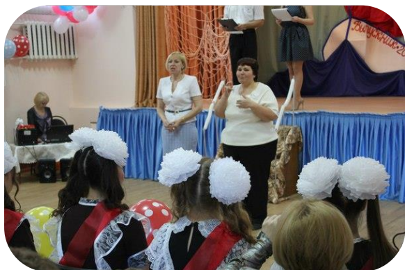
напутственное слово капитана