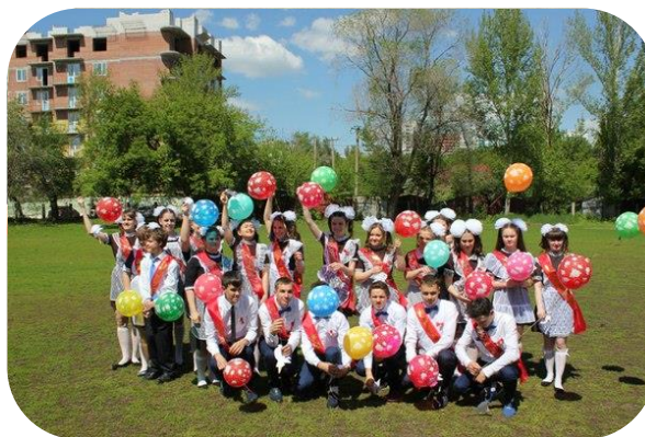
по школьной традиции выпустили надувные шары в небо