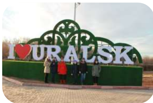
Экскурсия по городу